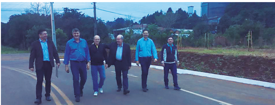
Asfalto beneficiou trabalhadores de cinco empresas do município

O deputado Marcos Vieira repassou recursos para a prefeitura de Maravilha que foram usados na pavimentação de 4.537 metros em trechos da Rua das Hortên-