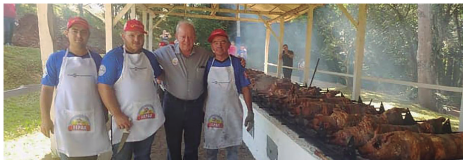
Deputado Marcos Vieira destinou recursos para a implantação da rede de iluminação do Parque da Fepar, em Modelo

O deputado Marcos Vieira está sempre presente nas festas comunitárias da região. É assim em Modelo, onde ajudou a implantar a iluminação do Parque Municipal, local da Festa Estadual do Porco Assado no Rolete (Fepar). Agora, vamos repassar R$ 200 mil para construir a Concha Acústica.