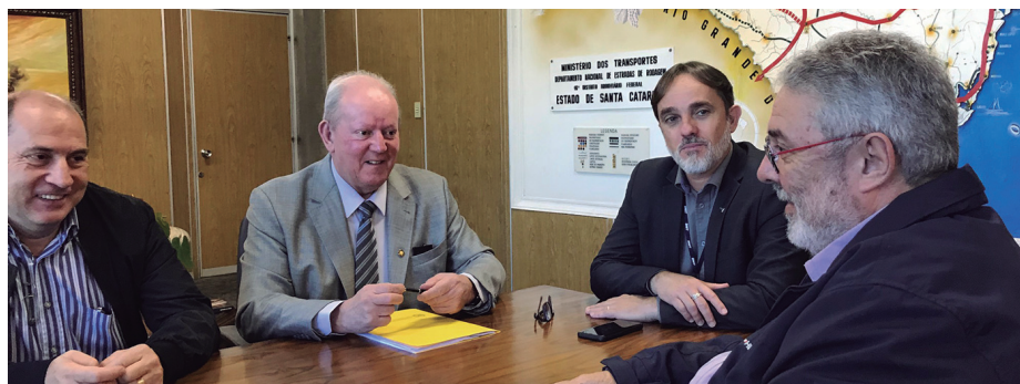
Deputado tem lutado por mais recursos para melhorias nas rodovias de todo o Extremo Oeste do Estado

Em Maravilha, a obra será do trevo da BR-282 até o CTG Juca Ruivo e vai garantir mais segurança aos moradores dos loteamentos Jardim Itália, Estrela e Aurora. "As obras são prioritárias e assim que os recursos forem liberados, pois já foram assegurados em Brasília, serão realizadas,