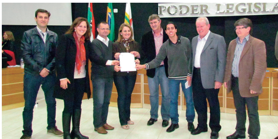
Deputado Marcos Vieira entregou ordem de serviço para a obra

O asfaltamento da rodovia entre Maravilha e Bom Jesus do Oeste é prioridade de muitos anos para a região. Em 2013, na Câmara de Vereadores (foto), o deputado Marcos Vieira entregou a ordem de serviço para elaborar o projeto.