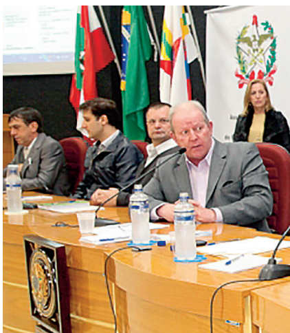
Em 2013, participamos de audiência para tratar da subestação da Celesc

Também vamos continuar trabalhando para mudar toda a rede elétrica, de monofásica para trifásica, única maneira de evitar que os produtores rurais e os empresários tenham problemas com a energia.