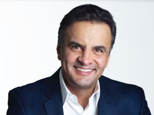
Aécio PRESIDENTE 45 Vice: Alyssio Nunes