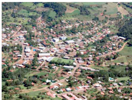
Vista aérea do município de Tunápolis