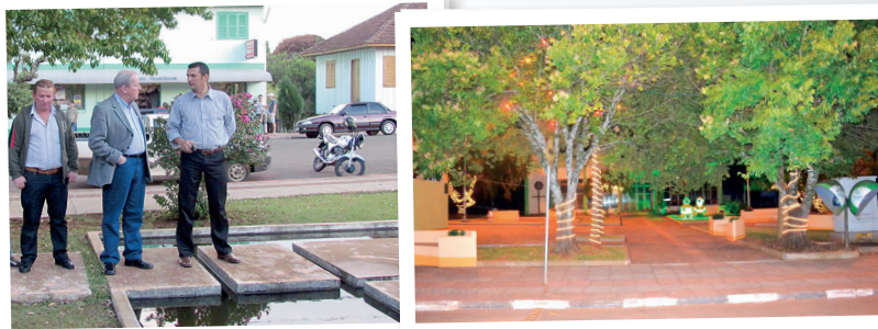
Deputado Marcos Vieira com o prefeito Gilberto Giordano e vereador Foguinho

O deputado Marcos Vieira viabilizou recursos para a revitalização da Praça Municipal de Santa Helena. O convênio de cooperação entre o Governo do Estado e a Prefeitura previu a destinação de R$ 180 mil para a realização das obras, em 2012. Na foto, Marcos Vieira visita a praça com as autoridades locais.