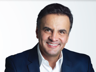
Aécio 45 PRESIDENTE | Vice: Alyssio Nunes