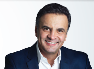
Aécio PRESIDENTE 45 Vice: Aloysio Nunes